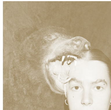
Impression : l'Atelier Fluo à Fontaine

Avec la complicité de la librairie La Palpitante